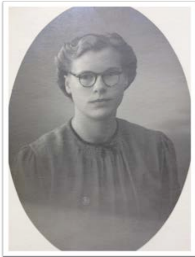
Inga som voksen kvinde.

Dog må jeg jo indrømme, at det var Mor, jeg var mest i kontakt med, og hun overlevede ham jo også i adskillige år.