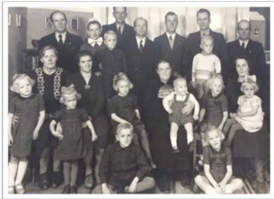
Og med børnebørn.